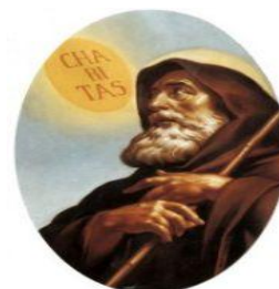
Francesco di Paola